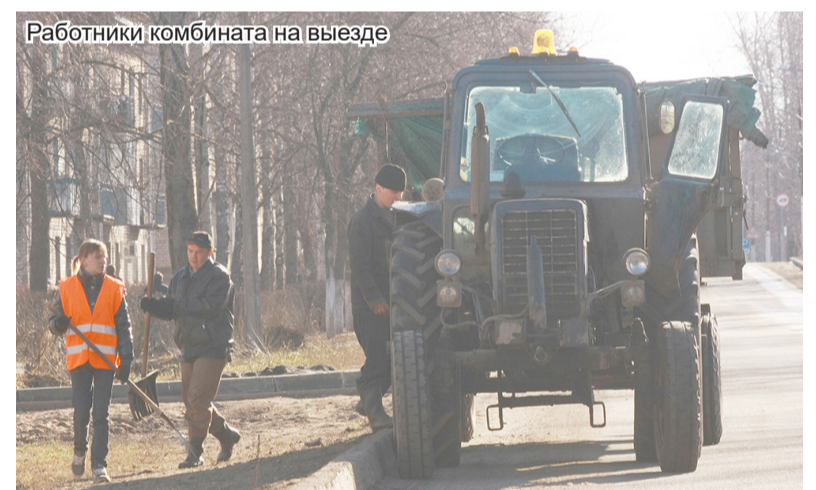
Работники комбината на выезде