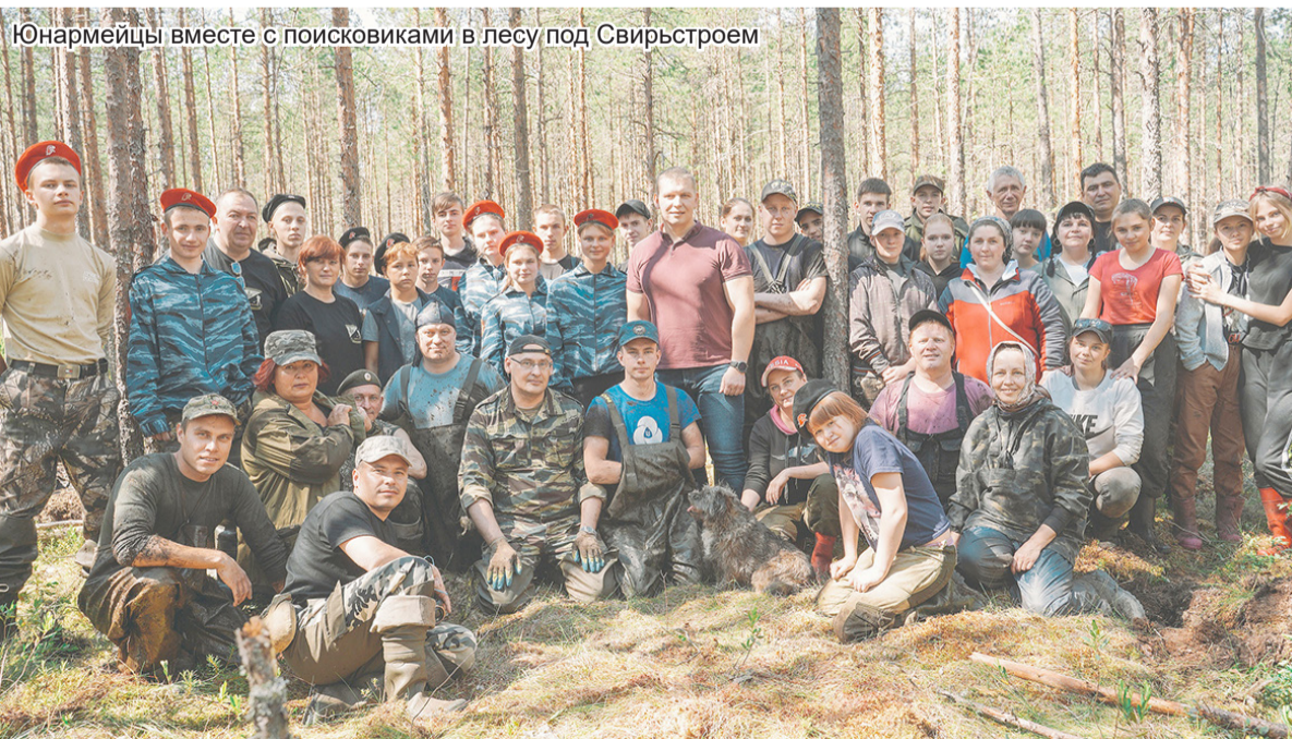
Юнармейцы вместе с поисковиками в лесу под Свирьстроом

Ольгерд СВИРСКИЙ