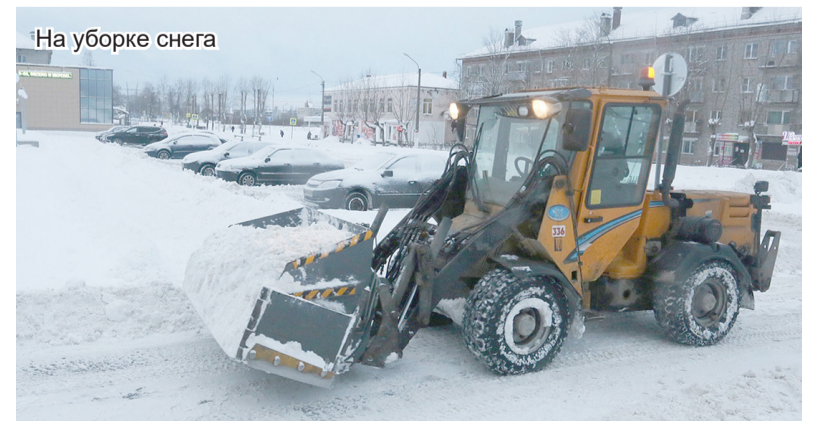
На уборке снега