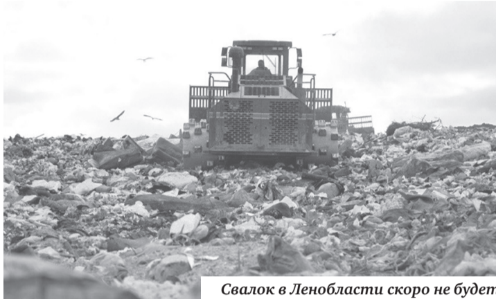
Свалок в Ленобласти скоро не будет