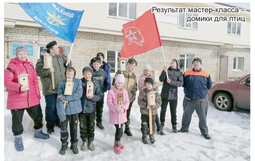
Результат мастер-класса – домики для птиц

- Основной помощник – региональный штаб Всероссийского движения «Юнармия», кроме того, взаимодействуем с «Боевым братством», отделом полиции, военным комиссариатом, Тихвинской епархией, Свирским монастырём и лично отцом на-