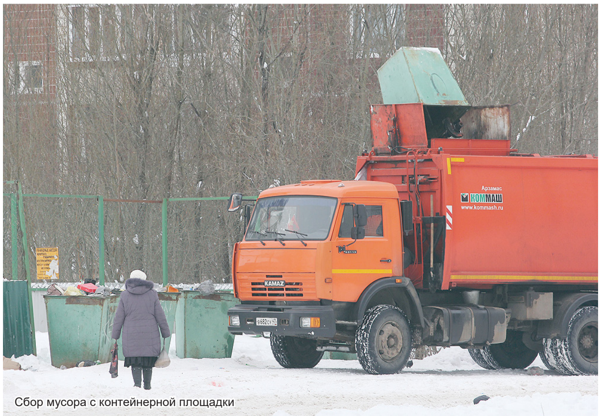
Сбор мусора с контейнерной площадки

ности граждан. В этом отношении средства массовой информации могут положительно повлиять, формируя у граждан экологическое сознание, но, естественно, всё будет зависеть от каждого конкретного человека. Надо ещё чётко понимать, что экологическая безопасность – дело общее, и требует сортировки, без которой нельзя организовать процесс полной переработки. Современный пластик очень многообразен, но именно он является главным загрязнителем окружающей среды, так как его естественное разложение может продолжаться веками. В идеале наступит время, когда все отходы будут попадать на вторичную переработку, однако пока об этом остаётся только мечтать.