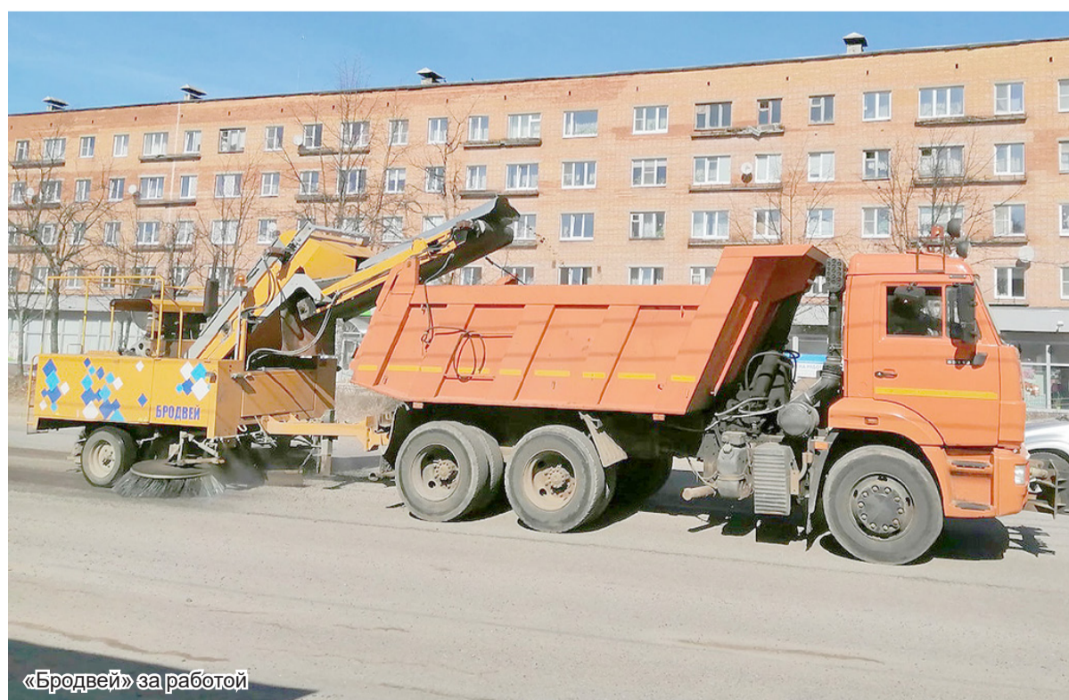
«Бродвей» за работой

Константин АЛИПОВ Фото Виктора БАРТЕНЕВА и из архива «Комбината благоустройства»